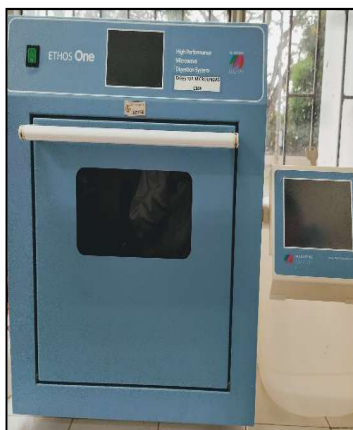
Imagen 6. Digestor Microondas Milestone.