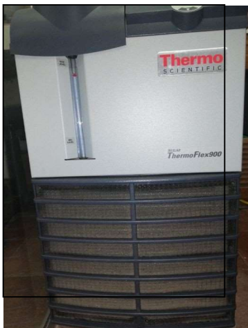
Imagen 1. Enfriador de agua Thermo Scientific ICE 3000.