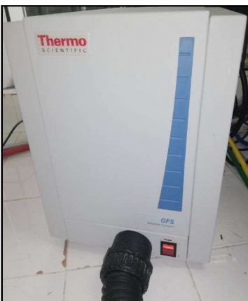
Imagen 3. Módulo de suministro de argón.