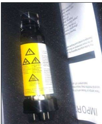
Imagen 5. Lámpara de cátodo hueco.