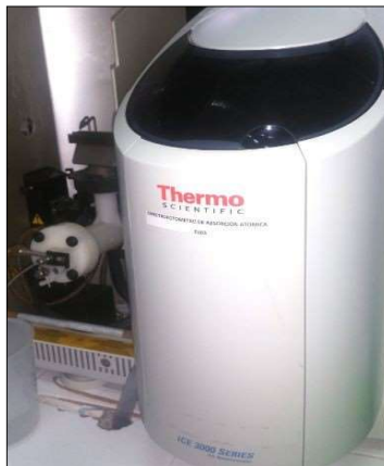
Imagen 2. Espectrómetro A.A. Thermo Scientific ICE 3000.