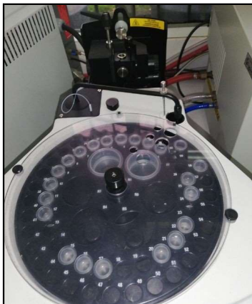
Imagen 4. Automuestreador